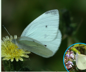
לכנין הצנזן פראשה הפגל