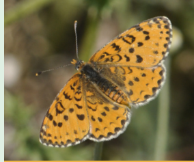
כתמית הבוצין חוריה העורור