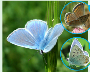
פחליל השברק פראשה הצרעא הצאעה

זמן התצפית 15 דקות. רשמו את כל הפרפרים שנצפו ומספרם והעבירו לטופס הדיווח את תוצאות הספירה.