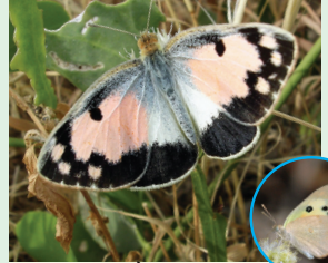
קרומי הסלנדורה פראשה הערב זאט הפעאט הצרעא