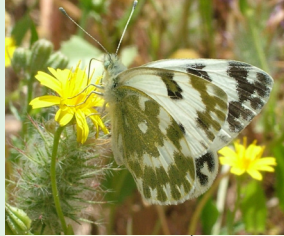
לכנין הרקפה פראשה באט הביצא