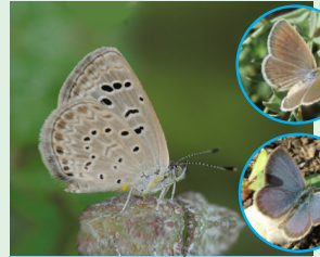
פחלון הקטב פראשה הצטב