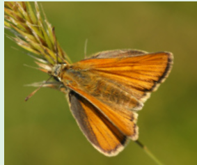
נחושת הנשרן הוואיה הצעירה