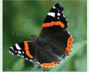
נימפית הסרפד חוריה הצראצ