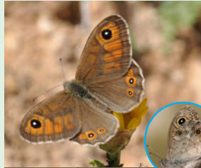
חומית היבולית פראשה הצחיל