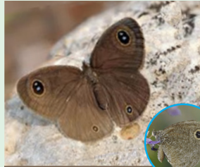
טבעית זוטית פראשה הרמדייה זאט הצלחא חלעא