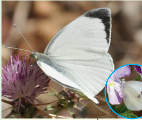
לכנין הכרוב פראשה המלפוף