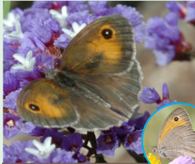
סטירית פקוקה מגאנייה רעאלה