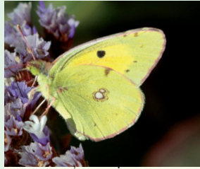
צ'קבונני התלקמן פראשה הנפל