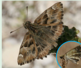
אפרית הקלמית וטאיה החביצה