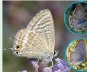
פחלון האפון פראשה הבאז לאה, פראשה הבסילה הצרעא