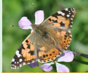
נימפית הקרשף חוריה הצרשופ