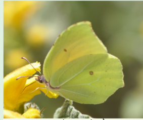
לימוני האשקר פראשה הסויד