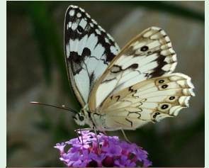
אביבית משושפת מגאנייה רחאמיה