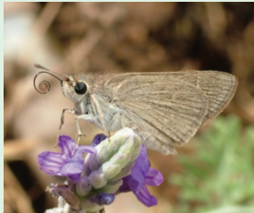
הספרית שוקרה פראשה החמיה הצאטלה