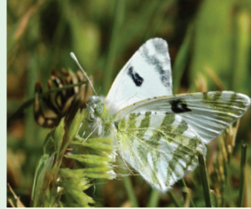
ירק-פנף מפסקס פראשה הביצא זאט החטוט הצצא