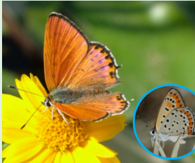
נחשמן הקמעה פראשה החמציצ