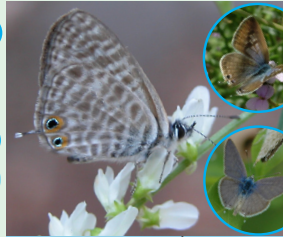
פחלון האסקסת פראשה הצרד הצרעא, פראשה החמר המחט הצרעא