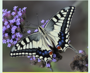
זנב-סגונית נצה חפאפיה הזיל-זיל הסטונו