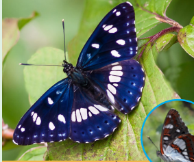
אצילית היצרה פראשה הביצא המזרכשה הצנבוייה