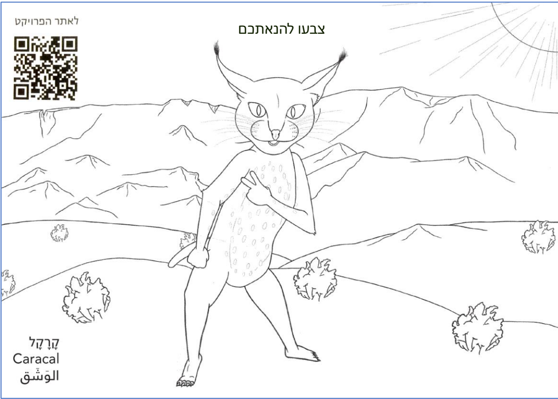
קרקל Caracal الوشق

צפו בקליפ, האזינו למילות השיר ופתרו את התשבץ: